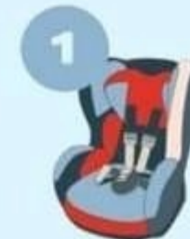
9-18 кг от 9 месяцев до 4 лет