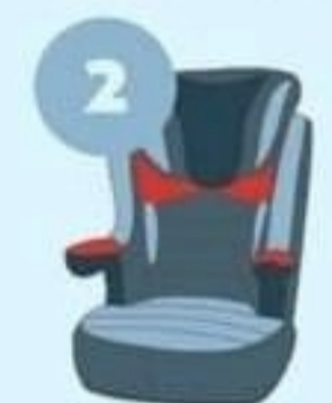
15-25 кг от 3 до 7 лет