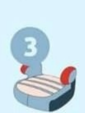
22-36 кг от 6 до 12 лет