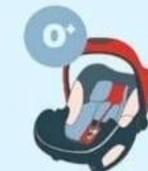
0-13 кг от рождения до 1 года